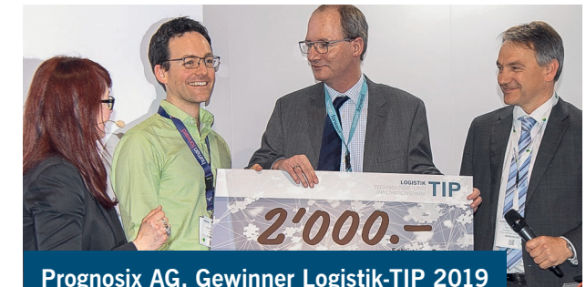
Prognosix AG, Gewinner Logistik-TIP 2019

Eine über 20-köpfige Jury wird die Aussteller und deren Innovationen hinsichtlich ihrer Attraktivität und ihres praktischen Nutzens für die Logistik beurteilen. Der VNL verleiht für die attraktivste Innovation ein Preisgeld von CHF 2 000, welches auf der Messe vergeben wird.